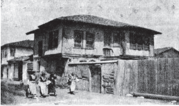
Amerikan Bord’un Samokov’daki okulunun ilk binası