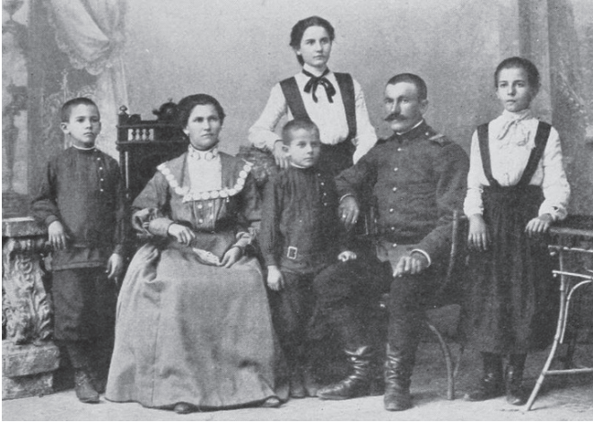
Metodist bir Bulgar ailesi

Albert L. Long, Tırnova'dan 1861 yılında yolladığı bir mektupta Protestan misyonerlerle gözükken bölge insanlarına karşı zulme varan muhalefetle karşılaşmalarının kendisini şaşırtmayacağını ve Bulgarlar arasında Protestanlığı yaymanın ciddi bir mücadele gerektireceğini ifade ettikten sonra şöyle yazmıştır: "Bulgarlar arasında tarifsiz bir kurnazlık ve aldatma ile birleştirilmiş büyük miktarda bağınazlık ve hoşgörüsüzlük vardır. Ahlaksızlık ve entrika okulunda öğretmenleri olan Rumların çok uygun öğrencileri olduklarını kanıtlamışlardır." 16 "Sözde Hristiyan" olarak tanımladıkları Rumlar, Bulgarlar, Ermeniler gibi bölgedeki topluluklar hakkında yaptıkları bu tür uygunsuz tanımlama ve ifadeleri Amerikalı misyonerlerin mektuplarında yer yer görmek mümkündür.