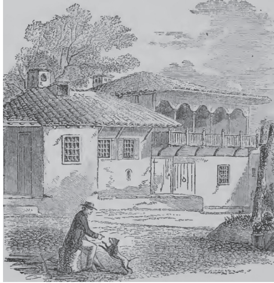
Amerikan Metodist misyonerlerin misyon binası, Şumla, Bulgaristan.

olan Albert L. Long, 1864 yılında yazdığı bir mektubunda kendi işlerinin tohum ekmek olduğunu, dağıttıkları kitap ve kitapçıkların bilhassa gençler tarafından istekle okunduğunu ve İncil satışlarının çok ümit verici olduğunu dile getirmiştir. Long aynı mektupta zeki ve genç bir Bulgar öğretmenin Moskova Üniversitesi'ne başlamak için Rusya'ya gitmeden önce kendisinden kitap istediğini ve ona yanında götürmesi için Amerikalı misyonerlerin bastığı kitapçıklardan verdiğini de belirtmiştir. Rusya'daki bir üniversitede ilahiyat okuyan dokuz Bulgar öğrencinin eğitimlerini tamamlamak amacıyla ABD'ye gitmek için kendisinden yardım istediğinden de Long aynı mektubunda bahsetmektedir. 14 1883'te yazdığı bir yazıda Cyrus Hamlin de Bulgarlarla Rusya arasındaki ilişkiye dikkat çekmiştir. Hamlin'e göre Bulgarlarla Rusya'nın sosyal ilişkileri yaygın ve sürekli. Bulgaristan'daki Protestan misyonerlik faaliyetleri en sonunda Rusya'daki milyonlarca insanı etkileyecek ve Bulgaristan'daki Protestan kiliseler Rusya'daki Protestan kiliselere yol açacaktır. 15